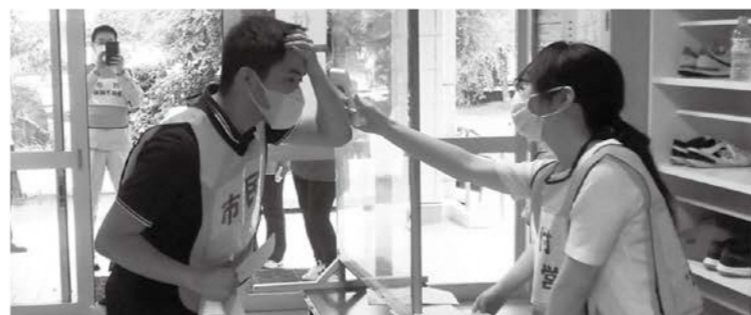
コロナ禍での避難者の受け入れ訓練

○災害対策本部設置訓練および初期対応訓練 災害対応体制や指揮命令系統を迅速に確立し、円滑な応急対応を行うため、災害対策本部設置訓練および地区本部を含めた初期対応訓練を行います。 ○情報伝達訓練 迅速かつ的確に災害情報などを市民の皆さんに周知するため、特性の異なる複数の情報媒体で情報伝達訓練を行います。