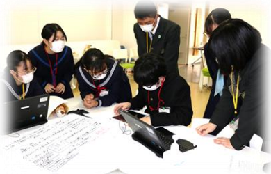
映像制作プロジェクト 【株式会社 アイフィールズ】