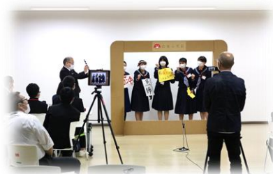
CMづくりワークショップ 【株式会社 電通】