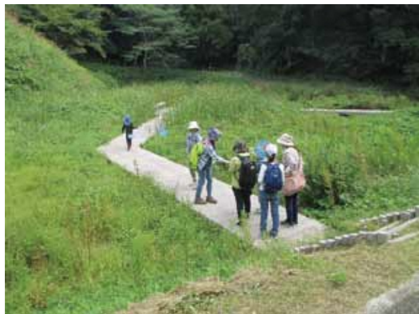
秋の親子自然探訪会の様子