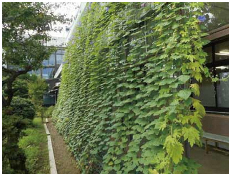
令和元年度 大賞作品

本事業は平成 25 年度から開催しており、令和元年度は 40 件の応募がありました。