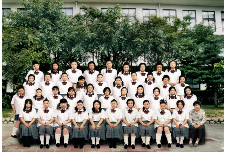
《School Days/E》 澤田知子 Cプリント/2004年 タグチ・アートコレクション