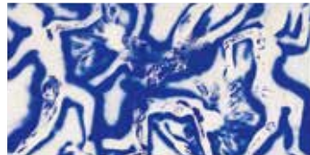
イヴ・クライン《人体測定 ANT663》1960年 いわき市立美術館