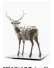
名和晃平《PixCell-Deer#51》2018年 タグチ・アートコレクション