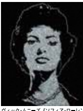
ヴィック・ムニース《ソフィア・ローレン (ダイヤモンド・デーヴア) (ダイヤモンドの 絵画)》2004年 Courtesy of the Artist タグチ・アートコレクション