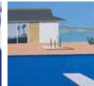
ジョナサン・モンク《7フアースプラッシュ》2006年 ©Jonathan Monk & Untlthen, Paris タグチ・アートコレクション