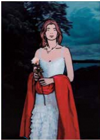
ジュリアン・オビー《赤いショールを纏ったマリア・テレサ》2008年 タグチ・アートコレクション