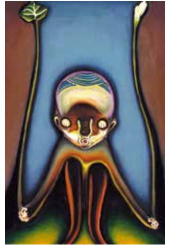
加藤 泉《無題 2009》2009年 ©2009 Izumi Kato, Courtesy of the Artist タグチ・アートコレクション