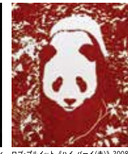
ロブ・プリット《ハイ・ハイ(赤)》2008年 Courtesy of Rob Pruitt Studio タグチ・アートコレクション