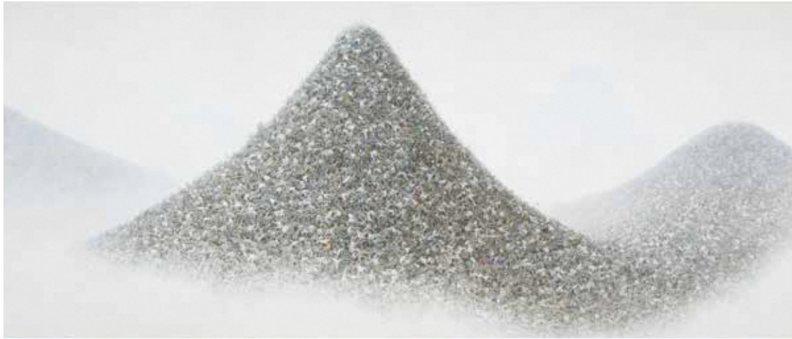
会田 誠《灰色の山》2009-11年 ©AIDA Makoto, Courtesy of Mizuma Art Gallery photo: Kei Miyajima タグチ・アートコレクション

美術館へようこそ！ 作品との出会いが巻き起こす様々なコミュニケーションを楽しみながら、新しい時代にこそふさわしい美術の魅力、美術のチカラをご体感ください。