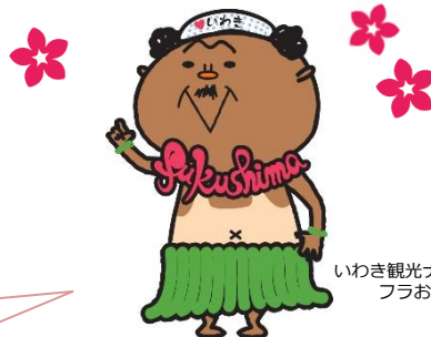
いわき観光ナビゲーター フラおじさん

問合せ先 いわき市 都市建設部 都市計画課 都市再生係 電話 0246-22-7513 (直通) E-mail toshikeikaku@city.iwaki.lg.jp