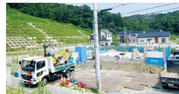
住宅の建設が進む平豊間地区

の最終段階に当たります。津波被災地域では、空き地のまま利用されていない土地も存在しているため、市では、沿岸部の復興とより住みたいまち、働きたいまちづくりに向けて「市空き地バンク」を開設し、移住・定住人口の増加やコミュニティの維持・活性化を推進するとともに、新たな雇用の創出と地域振興を図ることを目的に「市防災集団移転跡地活用事業」を実施し、企業誘致を推進しています。各事業の利用方法など詳しくは、同課へお問い合わせください。