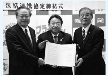
包括連携協定締結式

同協定に基づき、包括的な連携のもと、地域産業の振興および中小企業の支援や、地域課題の解決などについて、相互に協力しながら、さまざまな取り組みを実施してまいります。