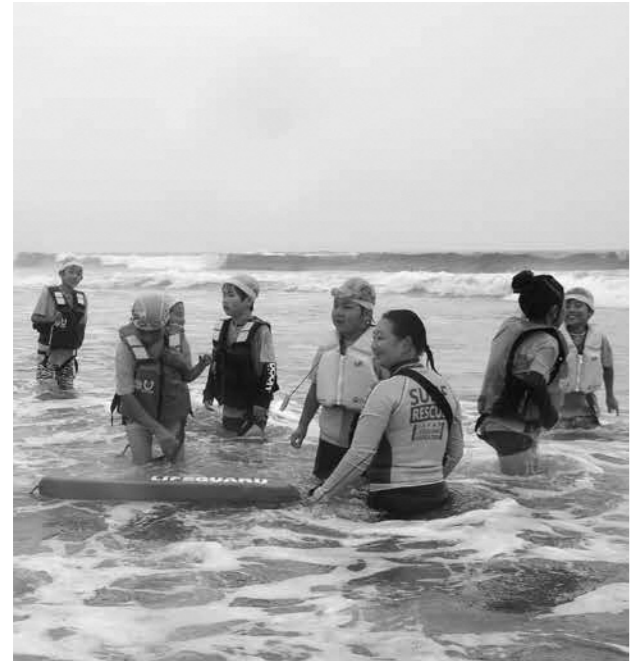
まちづくり活動（グレードアップ）支援事業の一例「海フェス2019 in Usuiso」

まち・未来創造支援事業 ○まちづくり活動（スタートアップ）支援事業 ▼対象 新たな公益的活動を始めようとする団体の事業 ▼補助額 補助対象経費の5分の4以内（上限20万円、助成は3回まで）