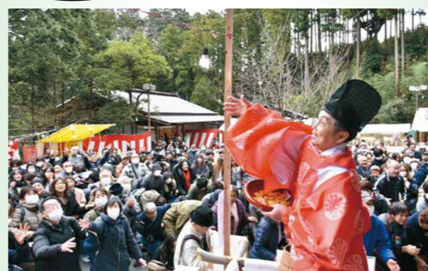
えびす様などがまく福銭に手を伸ばす参列者