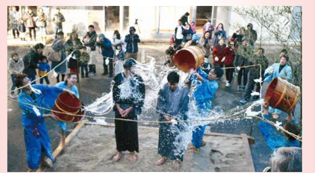
花婿に冷水を四方から掛ける水掛け祭りとも呼ばれる伝統行事で、無病息災や家内安全などを祈願