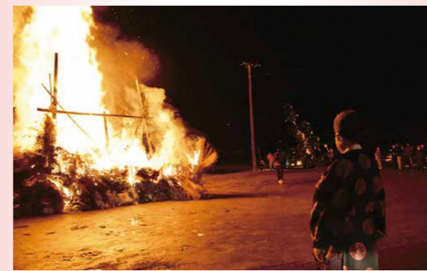
1年の無病息災などを願い行われた小正月の伝統行事