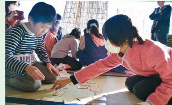
読み上げられた上の句を聞き、畳に広げた下の句を取り合う散らしなど、百人一首の遊びを学ぶ子どもたち