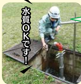
福島工業高等専門学校生インターンシップの様子

★学生さんの感想です★ ・現場の動きを実際に見て、その中で作業することが出来たことは、とても大きな経験になりました。 ・水道水をあらゆる観点から検査していることを知り、これによって不自由なく水が使えているのだと再確認しました。