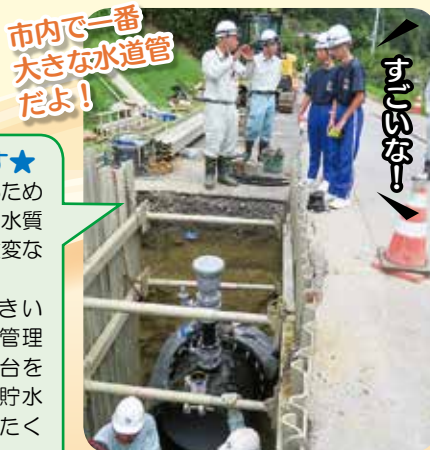
中央台南中学校生 職場体験学習の様子

★学生さんの感想です★ ・現場の動きを実際に見て、その中で作業することが出来たことは、とても大きな経験になりました。 ・水道水をあらゆる観点から検査していることを知り、これによって不自由なく水が使えているのだと再確認しました。