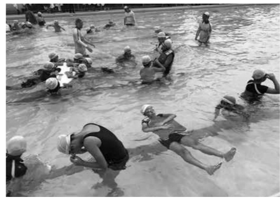
小学生に溺れたときの対処方法などを教えるメンバー

Q どんな活動をしていますか。 日本ライフセービング協会認定の講習会を開催し、ライフセーバーを養成しています。昨年は十人が資格を取得し、勿来海水浴場でパトロールを行いました。今年は薄磯海水浴場でも土・日、祝日に活動する予定です。また、小学校にライフセーバーが出向き、水辺で自分の身を守る方法を教える授業も行っています。団体設立前から携わっているイベント「海フェス」は、今月の十四日に薄磯海水浴場で開催します。子どもも大人も楽しみながら、ライフセーバーの技術を学べるプログラムを用意しています。 Q 海水浴場で監視をする際、心掛けていることはありますか。 まず、一番の基本は水難事故を起