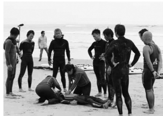
実際に海岸で行っているライフセーバーの資格を取得するための講習会

Q 団体を設立したきっかけを教えてください。 震災後、地区の住民の方から海水浴場の監視員が確保できず、海開きできないという話がありました。海水浴場が再開できないと、市全体の復興の雰囲気も盛り上がりませんと考えていたところ、ライフセーバーの存在を知りました。人命救助ができるライフセーバーがいれば、再開できる海水浴場も増えるのではないかと思います。まずはライフセーバーを知ってもらおうと、イベントなどを通じて普及活動に携わってきました。そのような中、勿来海水浴場で水難事故が起きたことを機に、ライフセーバーを地元で育成する仕組みを作っていく必要があると考え、昨年六月に団体を設立しました。