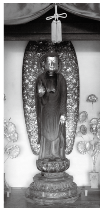
木造阿弥陀如来立像

来町 窪田第四区所有 像高は百二十五・五センチメートルで、頭から像底のほぞまで一つの木材で彫り出されており、力強い造形です。漆箔などで後に補修されたため、当初の姿が損なわれている点は惜しまれますが、構造や現状の造形から、鎌倉時代に彫られた像と考えられ、市の彫刻史の上で貴重です。