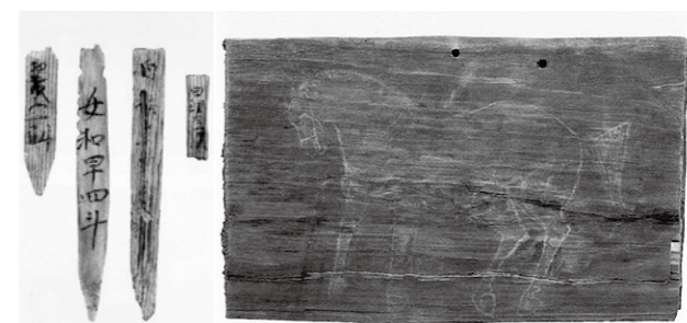
荒田目条里遺跡大溝出土品(一例)

品 常磐藤原町 市所有 常磐バイパス工事に伴い平成二年度に調査が行われた荒田目条里遺跡・砂畑遺跡第二百六十五号溝と、工場建設に伴い平成五年に調査が行われた荒田目条里遺跡第三号溝は、隣接して発見された古代河川跡です。調査の結果、大溝からは郡符木簡や、仏像・絵馬などの大量の木製品、祭祀遺物、古墳時代から平安時代にかけての墨書土器などの多くの土器類が確認されました。これらは、いわき地方の地方豪族の在地支配や律令祭