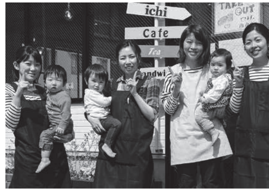
託児を利用しながら働くichiのスタッフの皆さん

Q ichiを始めようと考えたきっかけについて教えてください。 社会保険労務士として中小企業を支援する中、育児や介護に関する法律整備が進んでも、従業員が少ない中小企業などでは仕事との両立が難しいと感じていました。私も育児と仕事の両立で悩んでいたため、伸び伸びと育児と仕事ができる職場をつくりたいと考えたのがきっかけです。また、育児中で自分の時間を確保できないお母さんが、ゆっくりランチを楽しんだり、美容室や買い物へ行ったり気分転換したりする時間を提供したいと思い、託児サービス付きのカフェを始めました。ベビーカーが入りやすいようにして、子ども連れでも気兼ねなく飲食できる場所にしたという思いもありました。