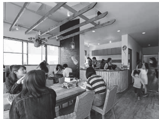
子ども連れなどのお客さんでにぎわう店内

写真撮影会、託児体験会などを行っています。今月はハロウィンパーティーも企画しています。託児体験会は、託児を利用したことがない方に向けて、託児や託児中の子ども様子を確認できるよう開催しています。Q 今後についてお聞かせください。 妊婦の方も利用しやすいお店にしたいと考えています。メニューなどを工夫して、気兼ねなく飲食できるようにしたいです。私自身、妊娠中に子育てに関する情報をあまり得ることができず、不安に感じたことがありました。不安が解消できるように、他の妊婦の方や育児中のお母さんと交流できる場所にしていきたいです。また、子どもをモチーフにしたオリジナルアイテムや、子ども向けのグッズなどを作成したいです。