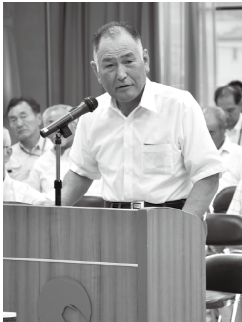
地区で増加している空き家の活用について提案