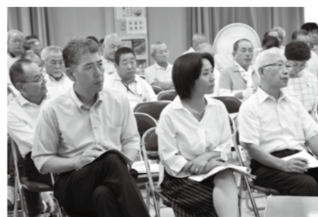
熱心に説明を聞く住民の皆さん

協力し、ごみ集積所適正利用推進啓発ポスター作品展を開催しています。最優秀作品は、実際にごみ集積所へ掲示しています。これにより、ごみ出しマナーが向上してきていますが、依然として、分別できない方がいます。ごみ出しマナー向上のための取り組みについて、市の考えを。