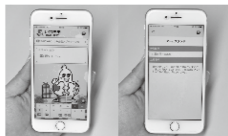
収集日の確認やごみの分類の検索などができる便利なアプリ

さらに、スマートフォンなどでごみの分別や、収集日などを確認できる市ごみ分別アプリの配信を行い、ごみの適正分別や、集積所の適正利用の推進に取り組んでいます。