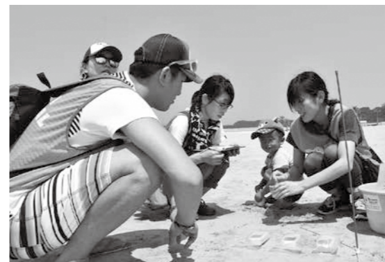
音や砂粒の大きさなどを測定する鳴き砂の調査

鳴き砂の普及活動としては、砂絵教室や砂像作りなどのイベントのほか、学校などで鳴き砂についての講座を開催し、子どもから大人まで、さまざまな方に興味を持ってもらえるよう取り組んでいます。