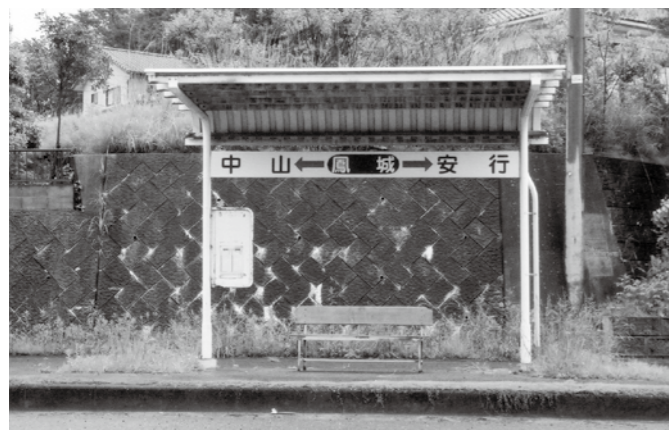
炭鉱会社名であった「鳳城」「安行」の名称が残るバス停留所〔平成20(2008)年6月 筆者撮影〕

通称地名には昔から言い伝えられる地名なども含まれ、その名称を主に使用する地域住民などの意識の推移によって変化します。坂の名称などは通称地名の好例ですが、例えばかつて苦労して上った坂であっても、自動車の普及により容易に通りに過ぎることができるようになると、坂という意識や重要性は薄れ、やがてその名称が消えていくというようなことも起こります。