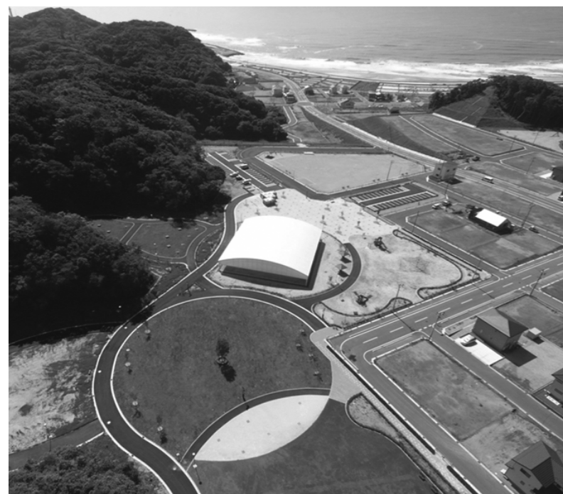
住民の皆さんの活動の場となるほか防災公園として機能

東日本大震災により甚大な被害を受けた豊間地区において、津波災害に強い地域づくりを推進するため、整備を進めていた豊間公園が完成し、供用を開始しました。 同公園は、地区住民の皆さんのスポーツ・レクリエーションの場や、地域イベントの場などとして利用できます。また、津波災害発生時には、住民の皆さん