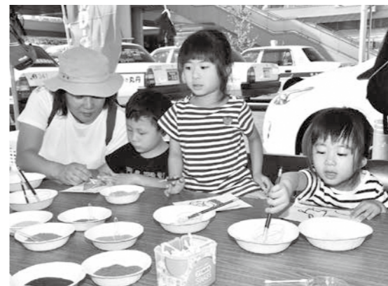
カラフルな砂を使って色付けする砂絵教室

鳴き砂の普及活動としては、砂絵教室や砂像作りなどのイベントのほか、学校などで鳴き砂についての講座を開催し、子どもから大人まで、さまざまな方に興味を持ってもらえるよう取り組んでいます。