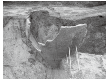
北境遺跡出土の縄文土器