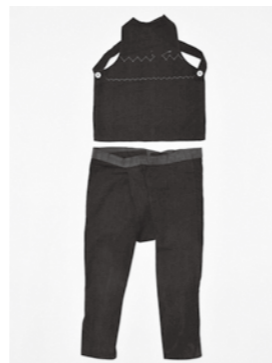
昭和20年ごろの祭り ▶ 衣装(幼児用)

市民の皆さんから寄贈された資料の中から衣類に焦点を当て、明治・大正・昭和初期ごろの衣類を展示し、当時の生活を紹介します。