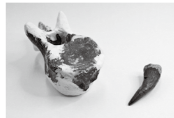
首長竜(ポリコティルス類)の椎骨(左)と歯

フタバズキリュウ発見から50年を記念し、発見時の逸話や経緯などについて、さまざまな首長竜の化石とともに紹介します。