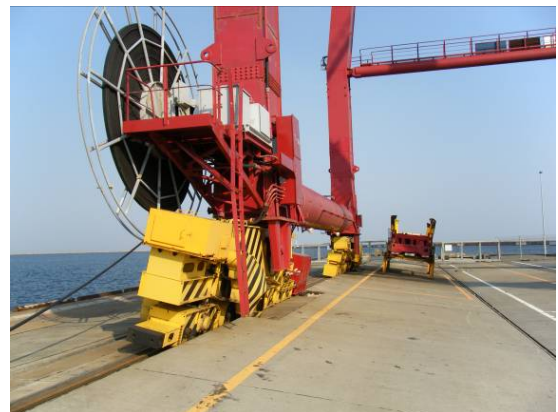
ガントリークレーン