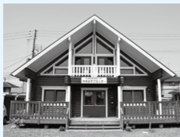
中央台サブセンター