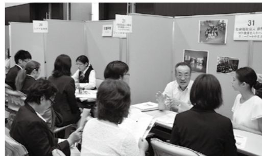
多くの企業が参加する合同就職面接会