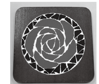
砕いたタイルでバラのコースターを作成

目 ① 8人 ② 15人 ③ 12人 ④ 各20人 ⑤ ⑥ ⑦ ⑧ ⑨ ⑩ ⑪ ⑫ ⑬ ⑭ ⑮ ⑯ ⑰ ⑱ ⑳ 料 ① 1千500円 ② 2千円 期 4月16日(月)9時から ☎で