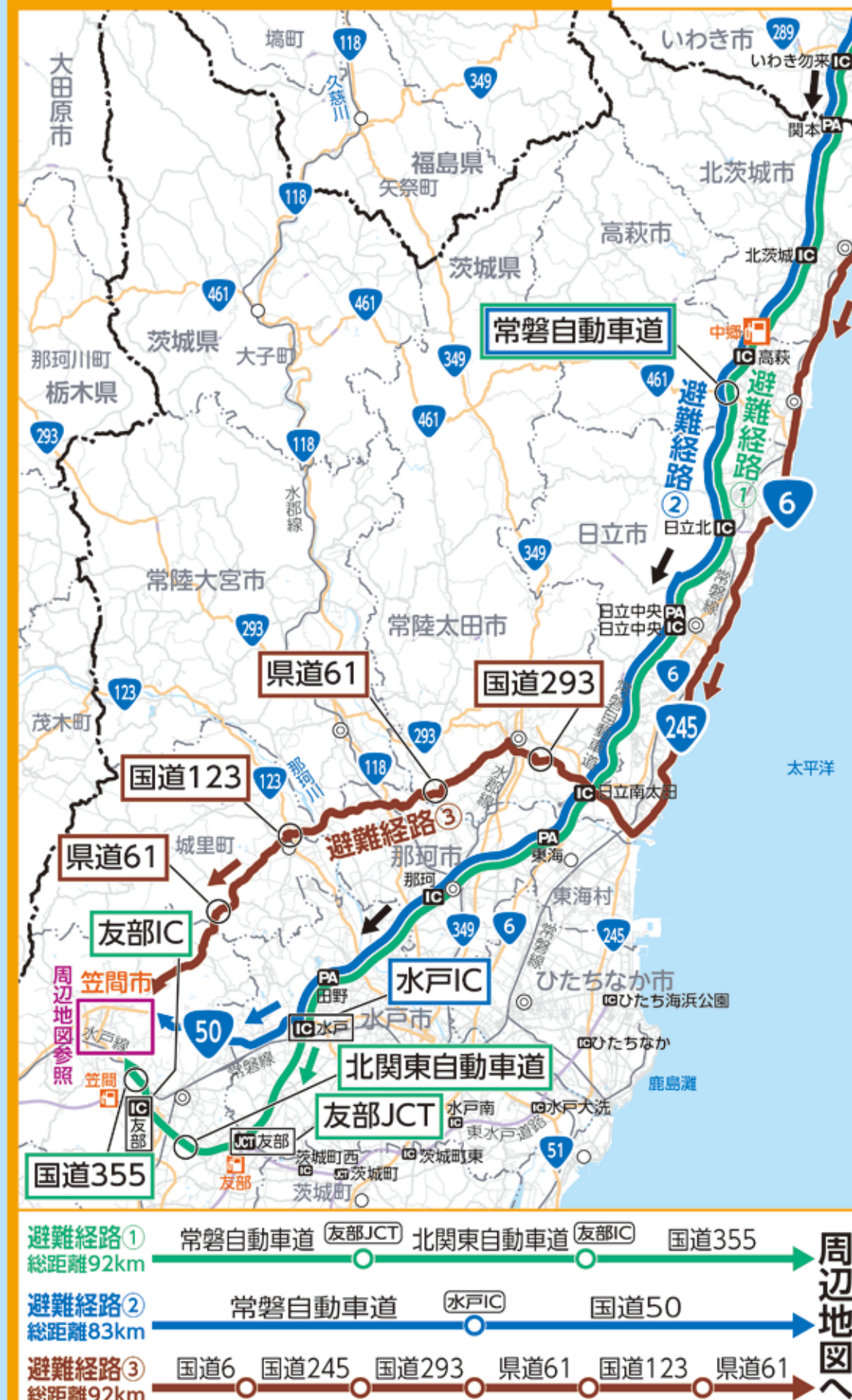
南方面避難経路周辺地図 1:15,000 0 300 600 900 1200m