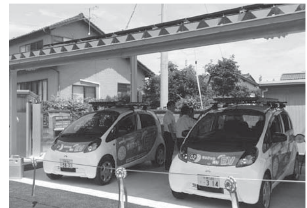
地域課題解決に資するビジネスモデルとしても注目を集めるEVのカーシェアリング

パの認証を取得するなど、地元企業の風力関連分野への参入は、着実に進展しています。