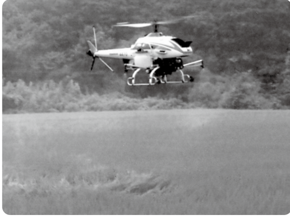
●防除中の無人ヘリコプター

散布を希望する人は圃場地番と圃場図面を申込時、責任者を通じて提出し、散布当日は現地責任者（圃場の分かる人）が立会い、今年も散布を依頼されていた127.6haの圃場を3チームによって防除作業を行いました。