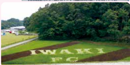
●平成29年7月中旬撮影