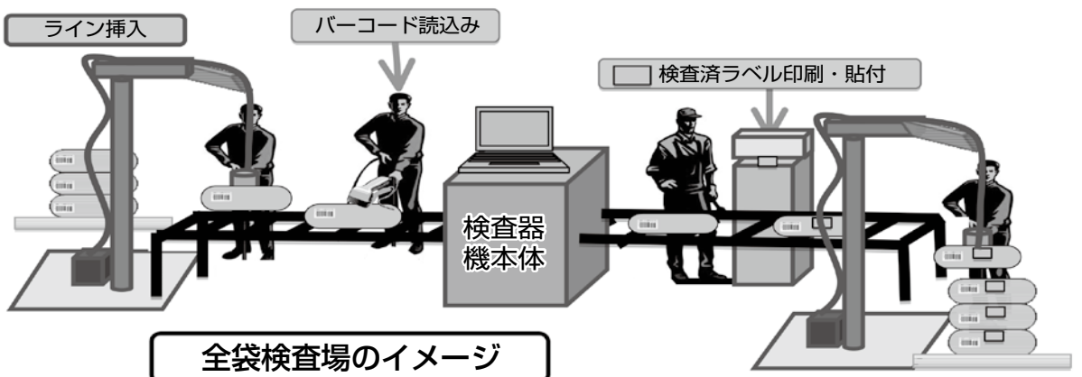
全袋検査場のイメージ

《検査等に関するお問い合わせ先》 いわき地域の恵み安全対策協議会 事務局 いわき市農業振興課 0222-11147