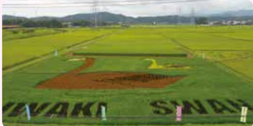
●平成29年8月上旬撮影