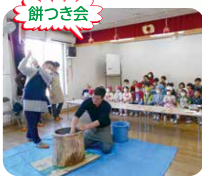
お正月行事の餅つきの様子