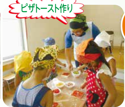
保育所の畑で採れた野菜を調理