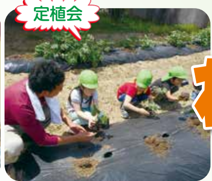
保育所の畑で野菜の定植