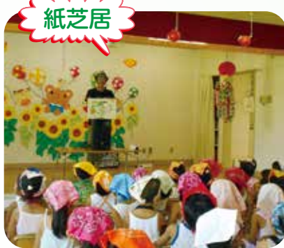
野菜をテーマにした紙芝居の披露

「農業ふれあい講座」は、いわき市農業青年クラブ連絡協議会が、毎年、市内の幼稚園・保育園等との協力でやっている食育活動です。 今回会場となった渡辺保育所でも、1年間、旬の野菜や季節の行事、農作業を通して、子供達と様々な交流がありました。 たくさんの子供達に、「食」や「農」の大切さを学んでもらえる良い機会になったのではないのでしょうか？ (執筆・撮影 小泉 昌男副委員長)