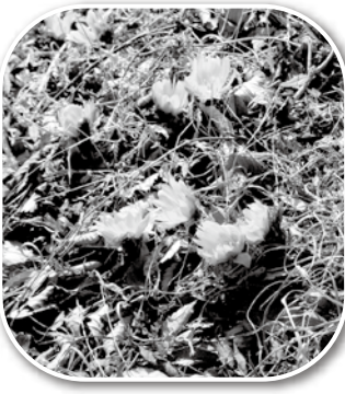
福寿草 (三和町下三坂)

背景となる写真は、白鳥山温泉「喜楽苑」(常磐白鳥町)の一足早い満開の梅花の様子です。馥郁(ふくいく)とした香りに誘われてメジロなどの鳥がやって来ております。