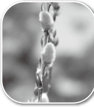
ピンクネコヤナギ (四倉町狐塚)