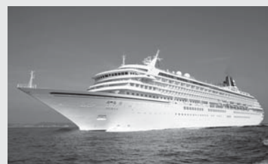
7年ぶりに寄港する飛鳥II