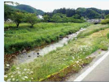
水道水源地(好間川沿い)の様子