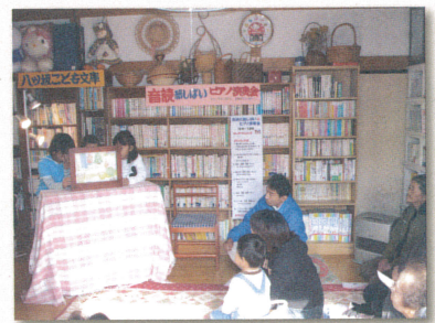
10年前のこども文庫の様子

A子ども文庫が公園以外に集まる場所がない子どもたちの居場所になれば幸いです。現在は夫がボランティアで登校時の交通安全の見守りをしています。毎朝声掛けをすることで、地区内の子どもたちとの繋がりができ、いじめや虐待の早期発見に繋がっているのではないかと思います。夢は地区の公園内に子ども文庫の分室を作ることです。