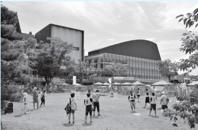
市制施行50周年記念式典会場のいわき芸術文化交流館アリオス〔平成28(2016)年8月〕

※いわき市内の昔の写真をお持ちで、提供いただければ、ふるさと発信課(☎22・7503)までご連絡ください。