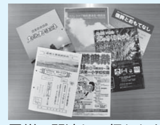
震災に関連して行われた事業のチラシなど

地域振興課中山間・沿岸地域係 ☎22-7415 震災の記憶や教訓を、後世に残していくことを目的とした「市震災メモリアル事業」では、震災の経験を記録する物や資料の所在調査を行っています。 震災に関する資料をお持ちで、貸し出しなどに協力いただける方は、いわき明星大学震災アーカイブ室（☎070-2667-1343）へご連絡ください。 対 東日本大震災の被害や、災害対応、当時の生活、復旧・復興の様子などを表す紙や映像資料、被害を受けた物など