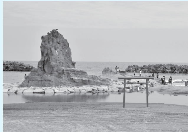
現在の二つ島(岩)。震災・津波の影響により、岩の形状にも変化が見られる【平成28(2016)年7月、いわき市撮影】

勿来海水浴場 本市の海水浴場は、鉄道の発達とともににぎわって来ました。もっとも早く開設されたのは四倉海水浴場で、明治三十五(一九〇二)年のことでした。次い