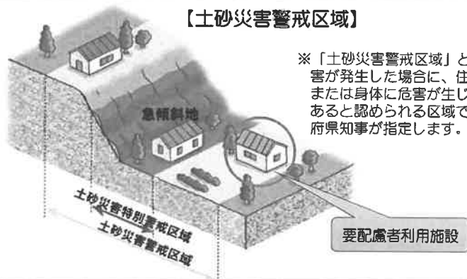
【土砂災害警戒区域】

※「土砂災害警戒区域」とは、土砂災害が発生した場合に、住民等の生命または身体に危害が生じるおそれがあると認められる区域であり、都道府県知事が指定します。