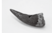
◀クビナガリュウの歯

クビナガリュウ、三葉虫など、いわきを代表する化石を一堂に展示し、この地に息づいた生き物の変遷から、その環境・歴史を探ります。