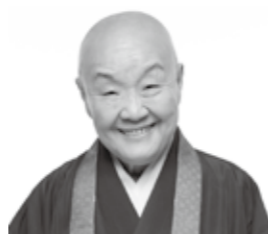
瀬戸内寂聴

瀬戸内寂聴作品の「愛」にちなんだ言葉を紹介するとともに、関連する自筆原稿や雑誌、書籍のほか、草野心平との交友を示す資料などを展示します。