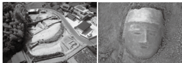
神谷作101号墳と出土埴輪

平成27年度に、市内で発掘調査が行われた遺跡の調査成果を、いち早く公開・展示します。