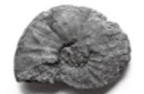
◀プリオノサイクロセラス