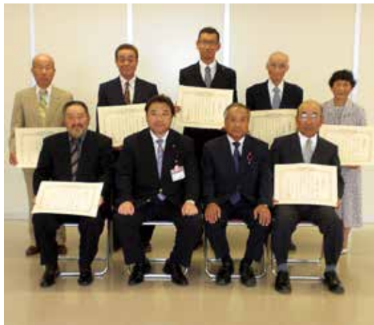
感謝状贈呈式記念撮影 (H27.7.23) 贈呈式出席者7名、市長・会長