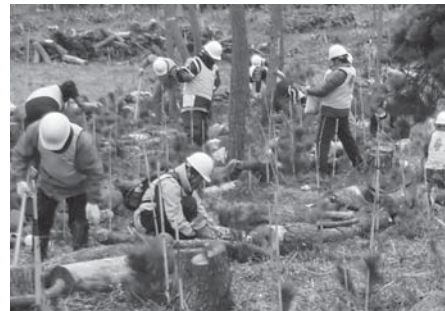
ボランティアによる植栽活動

対 高校、短大、大学などを卒業し進路が未決定の方や、コンピュータの技術を修得し再就職を考えている方 期 3月18日(金)~4月22日(金) 申 入学試験は、願書受け付け後に随時実施します。