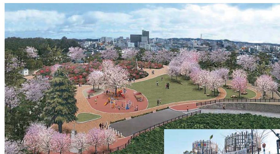
▲第一公園の完成イメージ