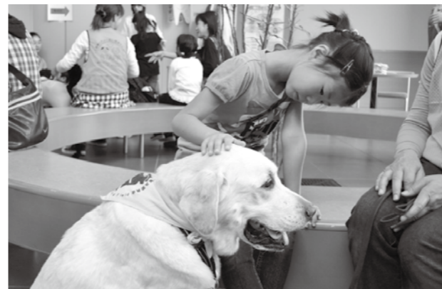
生活を豊かにする動物との触れ合い

近年、犬や猫などの動物を飼う家庭が増加し、人と動物との関わりはますます深くなっています。家庭で飼われる動物は、家族の一員や人生のパートナーとして安らぎや癒やしを与えてくれる存在となり、少子高齢化・核家族化が進