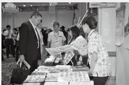
首都圏でいわきの魅力をPR

会場では、津波被災地における復興のまちづくりや、本市の水産業の現状などについて情報発信を行ったほか、小名浜港ポートセールスや新市立病院建設の取り組み、観光や企業誘致、