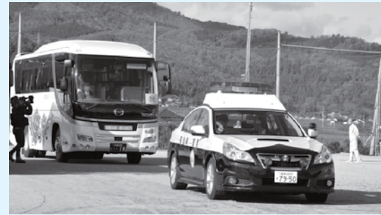
避難先に向け出発するバス(小川中)