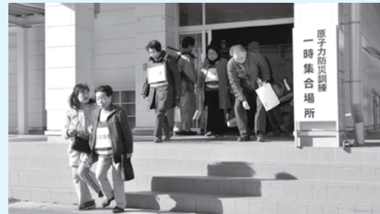
バスによる広域避難のため一時集合同所を出る住民の皆さん(小川中)