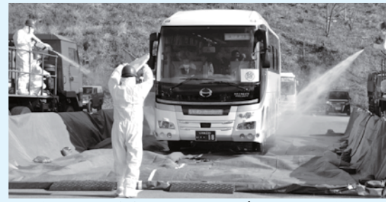
避難先での自衛隊によるバスの除染作業(三春町)