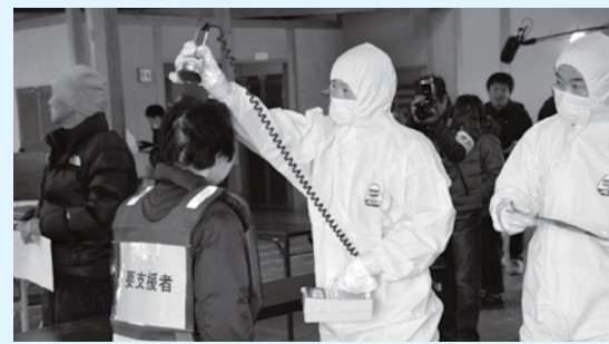
スクリーニング検査(三春町)