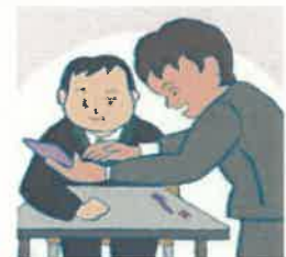
意思を伝え合うために絵や写真のカードやタブレット端末などを使う

注:「障害を理由とする差別の解消の推進に関する基本方針」(平成27年2月24日閣議決定)に基づき作成