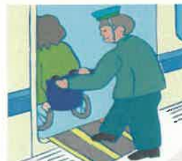
段差がある場合に、スロープなどで補助する