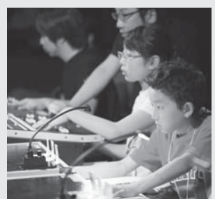
音響機材の操作体験

アリオスチケットセンター ☎22-5800 ○カスケード交流コンサートvol.25 山名敏之 チェンバロ on カスケードを開催 日12月1日(火) 12時15分～13時 所アリオス ※事前申し込みは不要です。 ○第16回たんけんアリオスの参加者を募集 日12月20日(日) 時①10時～正午 ②14時～16時 対小学3年生～中学3年生(小学生は保護者同伴) 定各回40人(先着順) 申11月21日(土)10時から ☎で