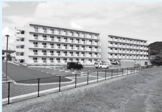
▲新川沿いに建ち、集合住宅2棟からなる北白土団地（平北白土）