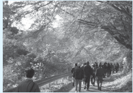
紅葉を眺めながら龍神峡を散策

料500円(高校生以上) 内実行委員会事務局(☎89-3311) ※小学生以下は保護者同伴。