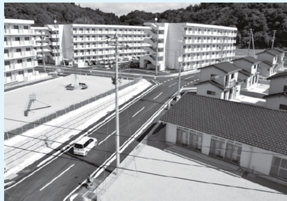
▲集合住宅5棟と戸建て住宅24戸からなる永崎団地（永崎字町田）