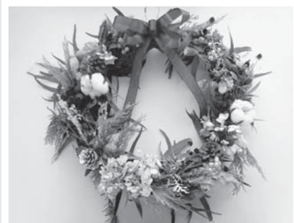
クリスマスリース