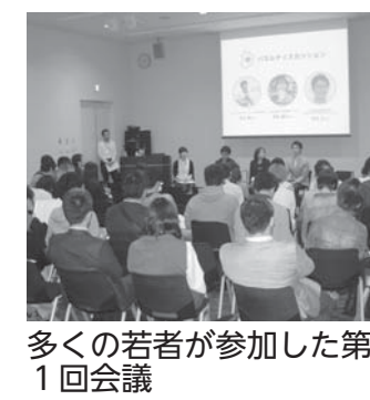
多くの若者が参加した第1回会議

日 ①タラと海の幸のブイヤベース ②来年1月13日(水) ②菜の花のクリームパスタ ②来年2月10日(水) 13時~15時 所 中央卸売市場研修室 定 各36人(先着順) 料 各千円 申 12月17日(木)以降の月・火・木・金曜日9時から15時に、参加費を添えて同協会へ