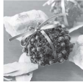
果物と香辛料で作るフルーツポマングー