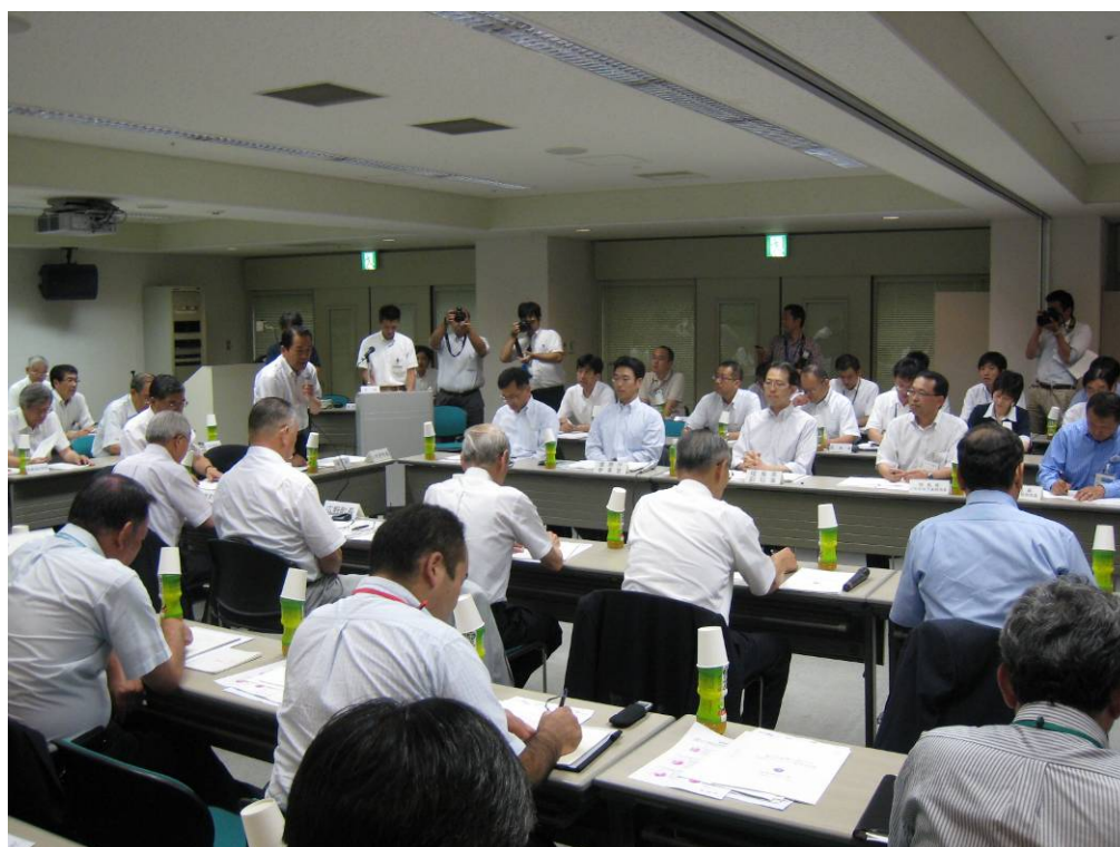
いわき市長と双葉郡 8 町村長との意見交換会（平成 24 年 8 月 28 日開催）