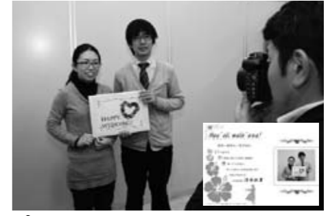
ポラロイドカメラで記念撮影

②いわき駅前市民サービスセンター(火・金曜日の10時～17時) ※いずれも祝日・年末年始を除きます。 ※取り扱い日時以外に、婚姻届を提出された方には、メッセージカードを後日贈呈します。