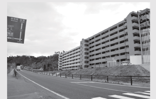
国道6号沿いに整備した久之浜団地1・2号棟(久之浜町久之浜)