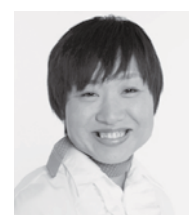
山崎 静代さん (タレント(お笑い芸人 南海キャンディーズ))

フラガールをきっかけに福島県とのご縁をいただき、こうして応援大使をさせていただき、本当に感謝しております。 これからも、何かもっとお手伝いさせていただきたいので、よろしくお願いいたします。