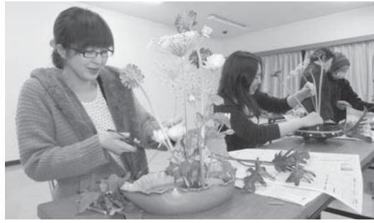
華道を楽しく学ぶ

勿来勤労青少年ホーム 各講座の受講者 ☎ FAX 63・2879 nakosokinro@city.iwaki.fukushima.jp ①年間講座(10~15回程度) Ⅱまかない料理、華道、茶道、着付け、シェイプアップダンス、パッチワーク、バドミントン、ヨガ、フラワーアレンジメント、バランスボール・ピラティス、手作りパン、料理、ベリダダンス、ビーズアクセサリー ②短期講座(5回程度) Ⅱラテンエアロ 時平日夕方2時間程度(年間講座の手作りパン、)