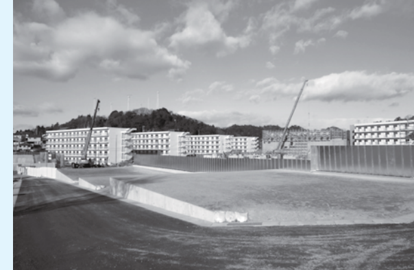
永崎字町田地内に整備した住宅団地(奥に見えるのは県と市がそれぞれ整備を進めている災害公営住宅)