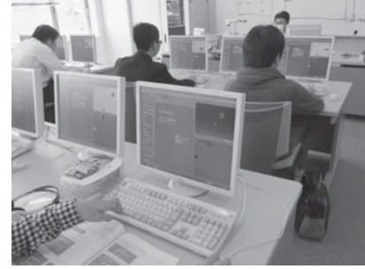
オープンカレッジ

期 3月20日(金)~4月24日(金) ※入学試験は、願書受け付け後に随時実施します。