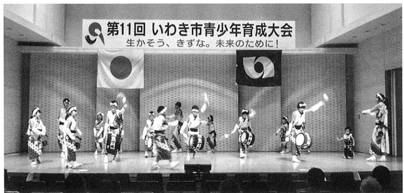
「下神谷子どもじゃんがら」によるステージ