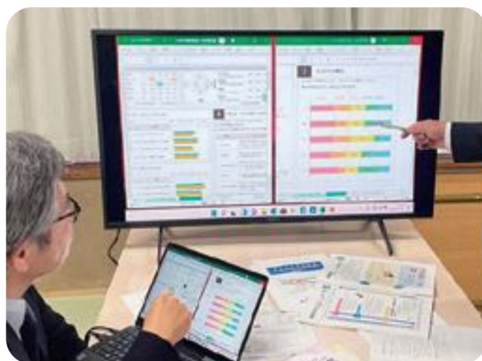
助言を行う学力向上アドバイザー