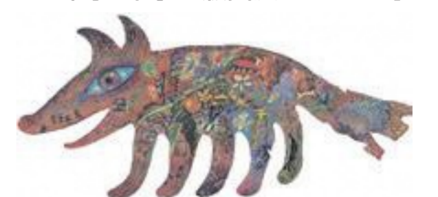
瀧池朋子(Little Wild Things) 2015年 サクラアートミュージアム蔵