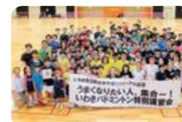
総合体育館リニューアル記念 バドミントン特別講習会