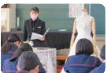
久之浜中(職業講話)