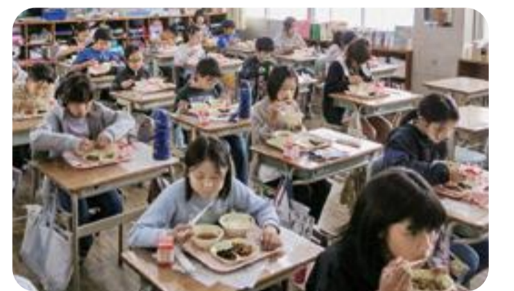
錦東小学校の給食風景