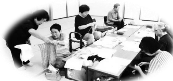
「手編みサークル」活動の様子