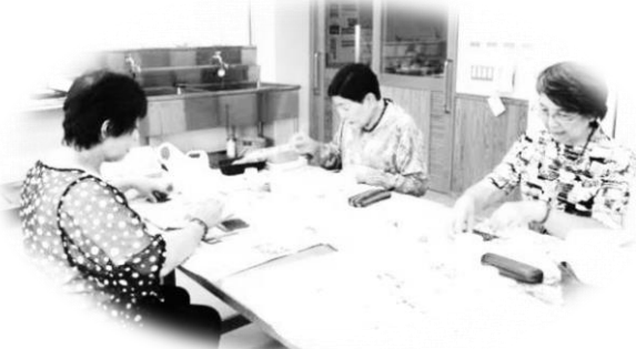
「田人七宝焼マーガレット」活動の様子