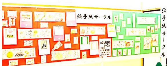
たびと絵手紙サークル