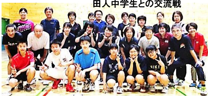
田人中学生との交流戦

現在「はなまるクラブ」では、30代から70代まで15名が在籍しています。バドミントンを通じて、日頃の運動不足解消、メンバー同士の交流、地域、他サークルとの交流など楽しく活動しています。主な内容は、クラブ内でのゲーム、他クラブとの交流戦、料理教室、親睦会などがあります。