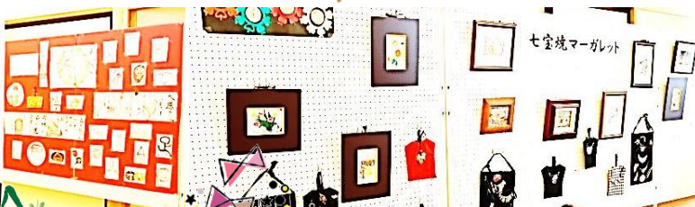
たびと七宝焼マーガレット