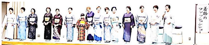
着物のファッションショー