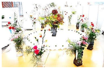
田人いけばなサークル