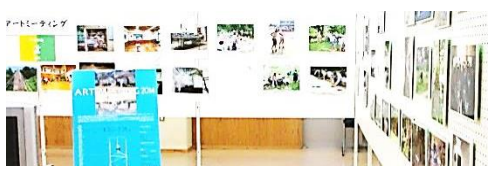
アートミーティング