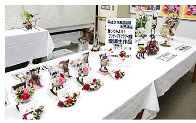
「飾ってみよう!」 プリザーブドフラワー教室