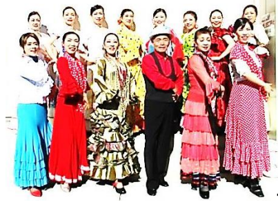
フラメンコショー