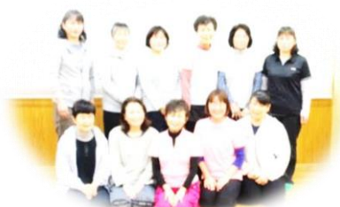
田人ピラティスサークル

前半にストレッチ、後半は有酸素運動を行い「モデルになったつもりで！」の先生のお声かけにみんなそれなりに(笑)がんばっております。元気に年を重ねいつまでも若々しく、美しい姿を夢見てサークル生15名和気あいあい楽しく活動しております。