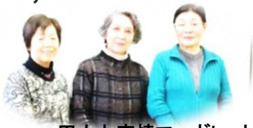
田人七宝焼マーガレット

田人公民館の創作室内七宝焼窯を利用してブローチ・ネックレス・ペンダント・ネクタイピン等の手作り作品を行っています。作り方は、銅版の上に、釉薬と呼ばれる色とりどりのガラスの粉末を盛り、700度〜900度位になった窯の中に、1分〜3分程入れて、冷まします。出来上がった作品の、デザインや色具合を、みんな楽しんでいきます。作ってみたい方は、是非、サークルにお入りになってください。