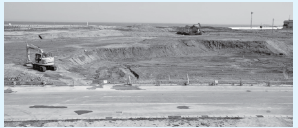
工事見学所からの眺望(南側)