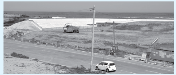
工事見学所からの眺望(東側)