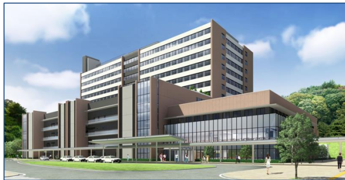
◆新病院完成イメージ