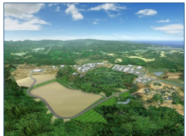
◆いわき四倉中核工業団地第2期区域造成イメージ