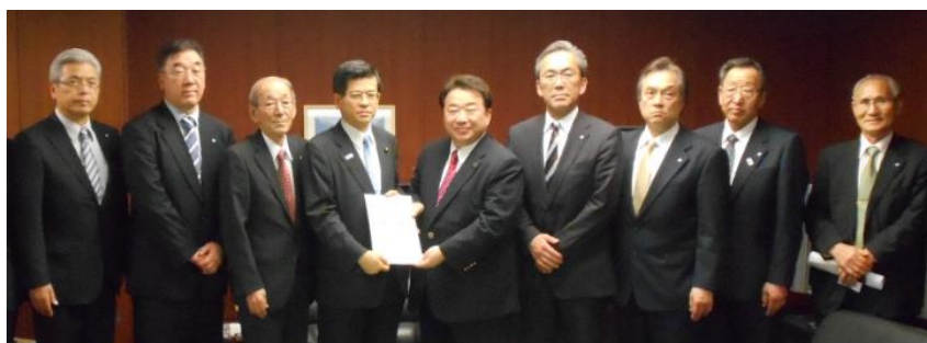
◆国土交通大臣に対し、 双葉郡8町村長と常磐線 のスピードアップ化など 合同要望（H28.4.27）