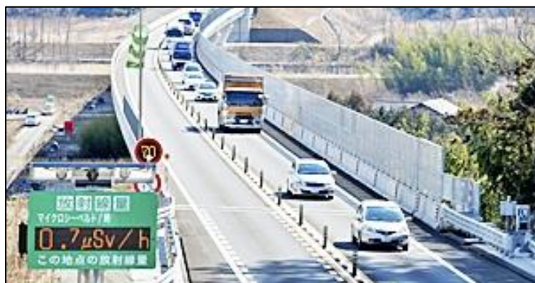
【全線開通した「常磐自動車道」】