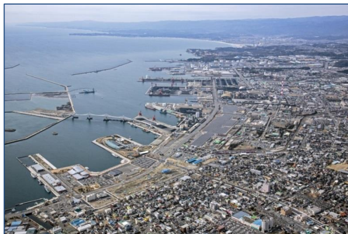
【小名浜港全景（H28.3撮影）】