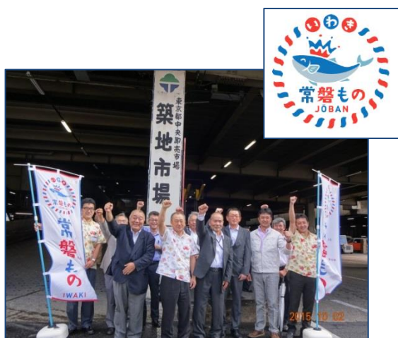
◆築地市場訪問（H27.10.2） ※常磐ものPR