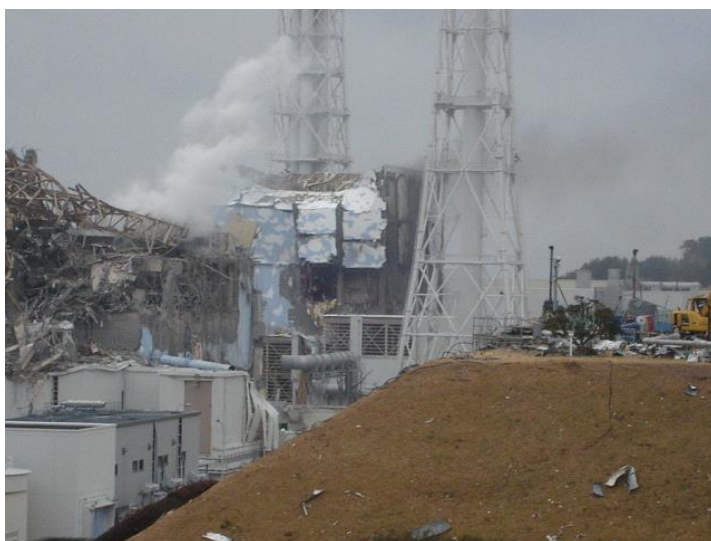
事故直後の福島第一原発の様子