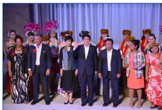
◆いわき太平洋・島サミット （H27.5.22～23） ※平成30年の次回の太平洋・島サミットも本市での開催が決定