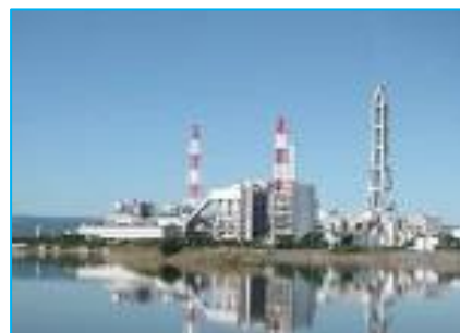
◆ I G C Cプロジェクト