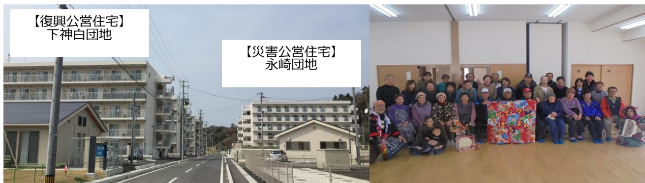
◆団地住民による「秋祭り交流会」 (H28.11)