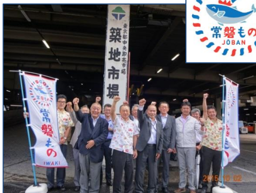
◆築地市場訪問（H27.10.2） ※常磐ものPR