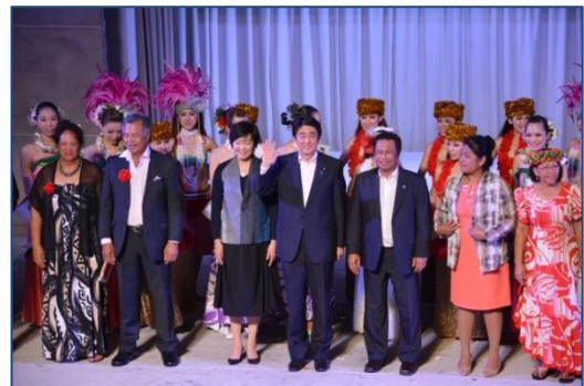
◆いわき太平洋・島サミット （H27.5.22～23） ※平成30年の次回の太平洋・島サミットも本市での開催が決定