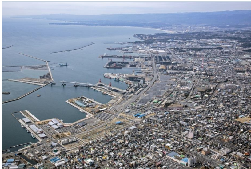
【小名浜港全景（H28.3撮影）】