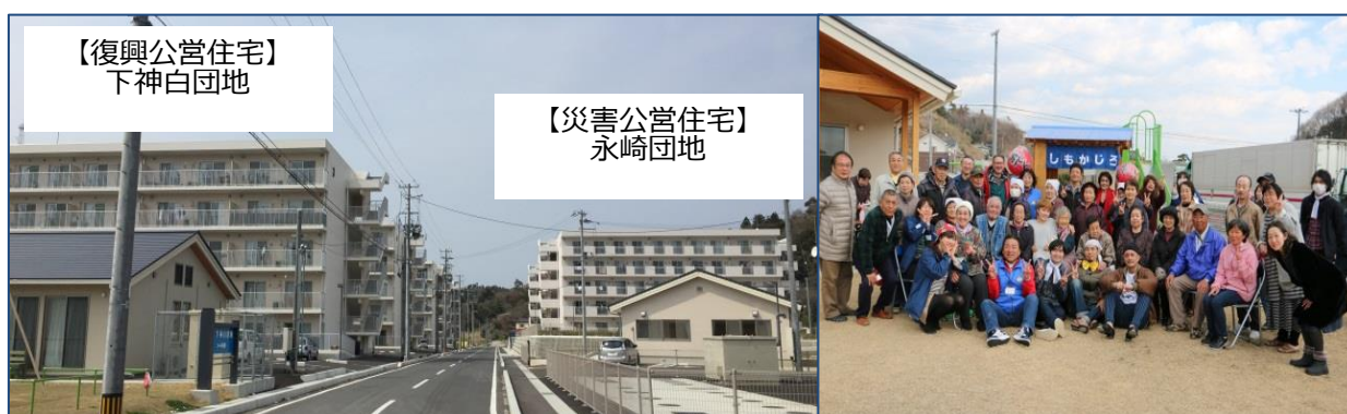
◆団地住民による「おでん交流会」 (H28.3.3)