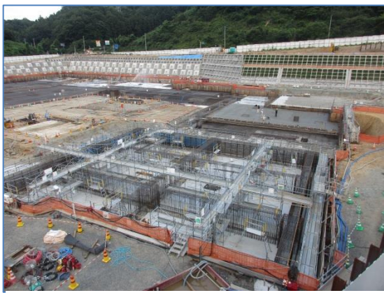
◆建設工事が進む新病院