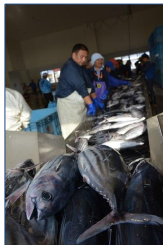
◆小名浜港で今シーズン初のカツオの水揚げ（H28.6.6）