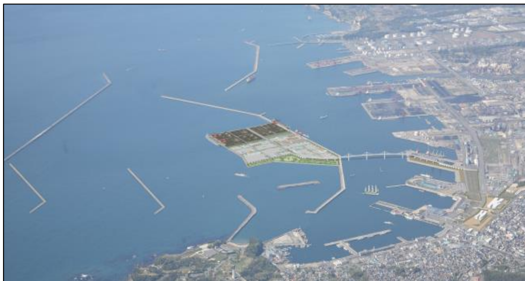
【小名浜港東港地区完成時のイメージ】