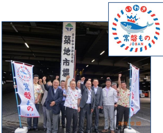
◆築地市場訪問（H27.10.2） ※常磐ものPR

さらに、観光交流人口の回復には、本市の安全性や復興に向かう姿を多くの皆さんに知っていただくことが重要であることから、市内で開催されているイベント等の情報発信について、力強いご支援をお願いいたします。