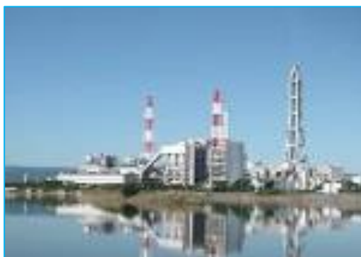
◆ I G C Cプロジェクト