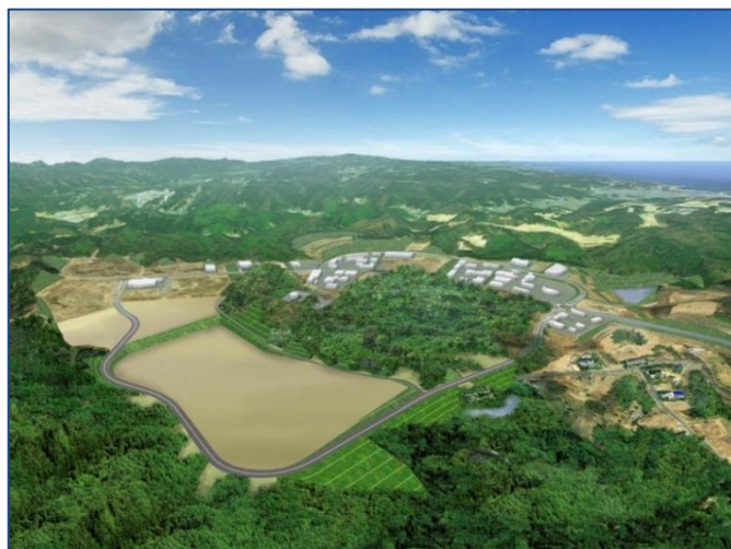
◆いわき四倉中核工業団地第2期区域造成イメージ

国におかれましては、本工業団地の整備が着実に進展し、分譲が開始されることにより、浜通りの復興が着実に進展し、加速されるよう、関連公共施設の整備に対し、十分な財政支援を措置してくださるよう要望いたします。