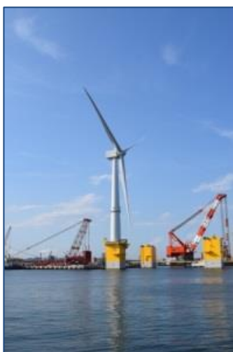
◆ 7 MW 風車

このため、太陽光発電や風力発電、蓄電池関連産業など、本市の企業が取り組む再生可能エネルギー関連事業の振興に向け、特段のご配慮をお願いいたします。