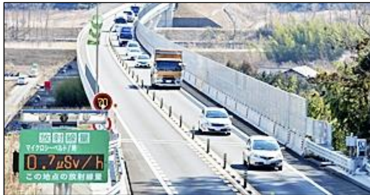
【全線開通した「常磐自動車道」】

しかしながら、本路線は、これまで大雨や東日本大震災の巨大余震などにより、全面通行止めとなるような大規模崩落がたびたび発生している状況にあることから、災害に強く、安全で円滑な交通を確保するための、才鉢工区を含む未改良区間の一日も早い抜本的改良を強く要望いたします。