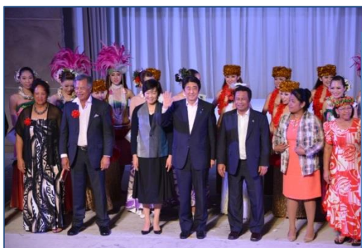
◆いわき太平洋・島サミット（H27.5.22～23）