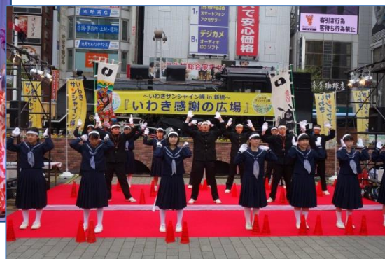
◆いわきサンシャイン博 in 新橋「いわき感謝の広場」（H28.4.21）